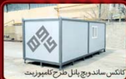
کانکس ساندویچ پانل طرح کامپوزیت