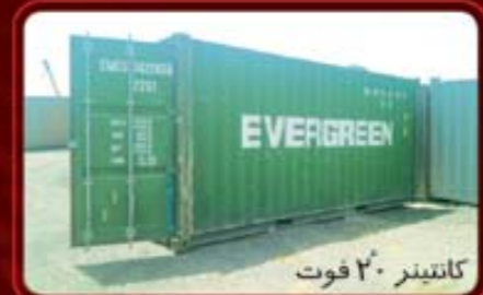
کانتینر ۲۰ فوت