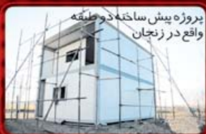
پروژه پیش ساخته دو طبقه واقع در زنجان

نماهای اسکلت تپ یک کانکس کاوه همراه با ضد زنگ کامل با اجراء بادبند جهت استحکام بیشتر