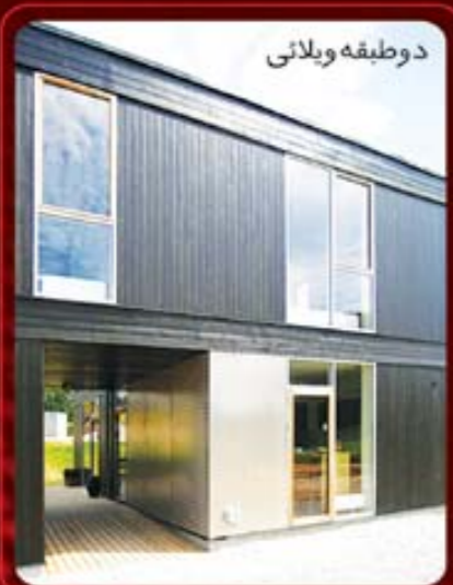
دو طبقه ویلانی