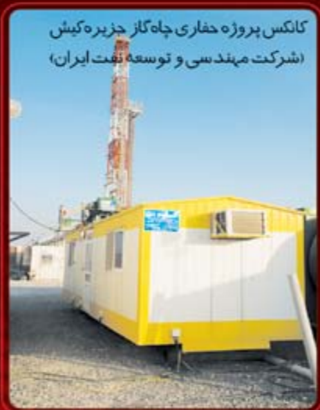
کانکس پروژه حفاری چاه گاز جزیره کیش (شرکت مهندسی و توسعه نفت ایران)