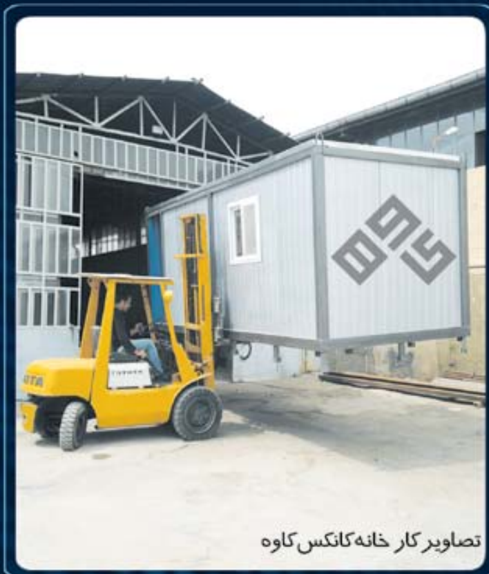
تصاویر کارخانه کانکس کاوه